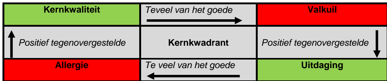
Schema 7.1 Kernkwadrant